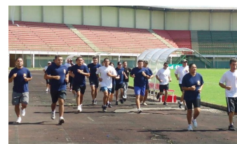
Guardas municipais na pista de atletismo do Caranguejão