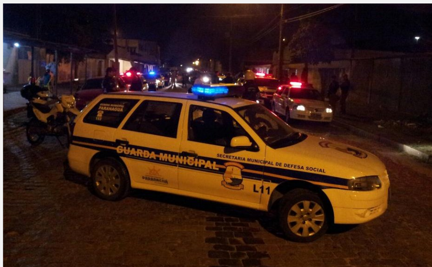
A fiscalização resultou na abordagem de cerca de 30 estabelecimentos comerciais

O comboio policial, estendeu-se pelas ruas do município com mais de doze viaturas e ainda o apoio de um helicóptero e cães farejadores, reunindo Polícia Federal, Polícia Civil, Polícia Militar, Guarda Municipal,