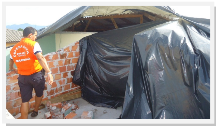
A equipe da Defesa Civil esteve em todos os bairros para verificar "in loco" estragos feitos pelo vendaval

As dezesseis famílias (70 pessoas no total), residentes no local da ocorrência, foram alojadas no salão do Conjunto Residencial e algumas estão temporariamente na casa de parentes e amigos. Algumas casas próximas sofreram grandes danos, devido aos destroços do telhado que foram arremessados sobre as resi-