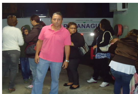
Café da manhã ofertado aos passageiros que viajam para tratamento