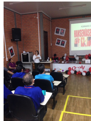
Palestras em Empresas - Fertipar, BRF, e Unidades de Saúde