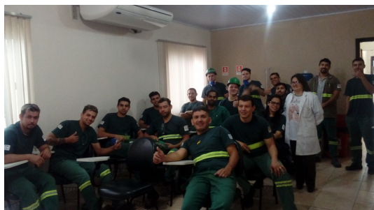
T D O - Tratamento Diretamente Observado