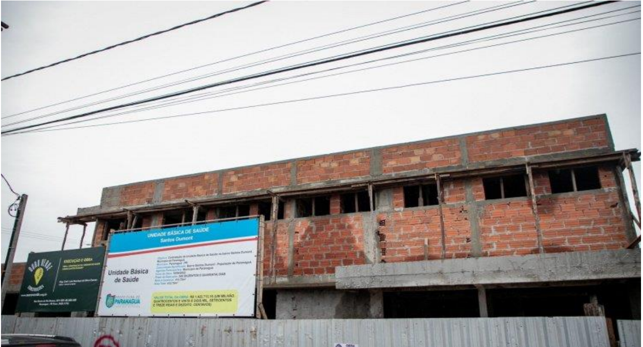
Comunidade indígena da Ilha da Cotinha ganha Unidade de Saúde – 02 de dezembro