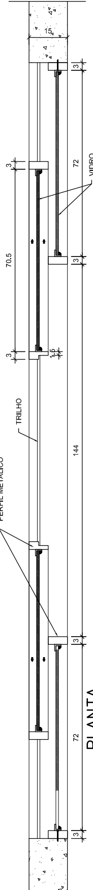
PLANTA ESC. 1/10