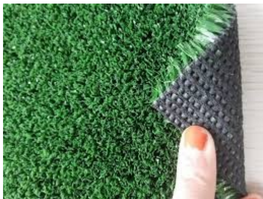
FIGURA 7 - IMAGEM DA GRAMA SINTÉTICA

Site: www.paranagua.pr.gov.br e-mail: cpl@pmpgua.com.br