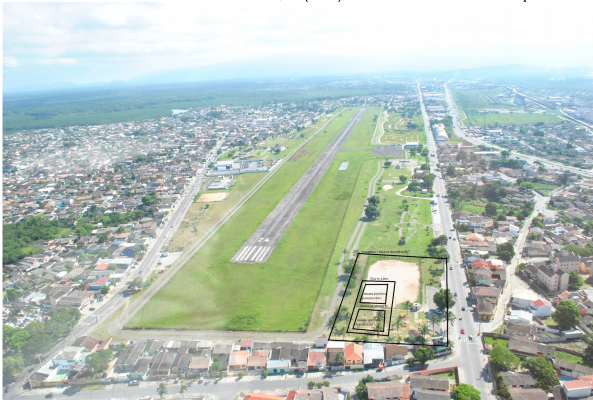
FIGURA 3 – IMAGEM COM A LOCALIZAÇÃO DA INTERVENÇÃO (PMP)