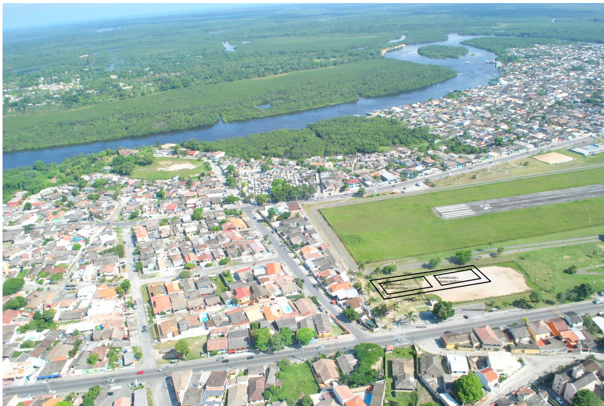
FIGURA 4 - IMAGEM COM A LOCALIZAÇÃO DA INTERVENÇÃO (PMP)

Site: www.paranagua.pr.gov.br e-mail: cpl@pmpgua.com.br