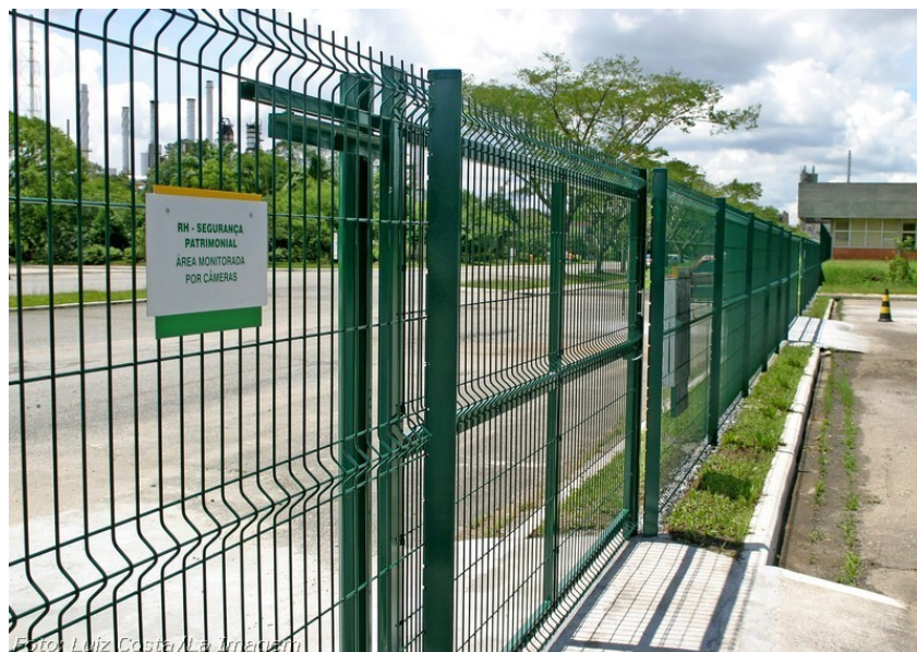
FIGURA 13 - IMAGEM PORTA DE CORRER DO GRADIL

Gradil de proteção confeccionado com fio 4mm galvanizado e pintado eletrostaticamente na cor verde, sendo cada placa de 2,50m de comprimento e 2,00 de altura, com postes de 7x7cm galvanizados, para fixação instalados a cada 2,50m, gradil fixo com sistema de grampos, com portão de acesso confeccionado em tubo galvanizado.