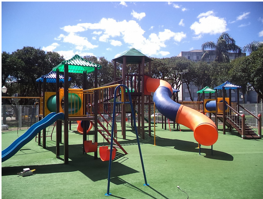
FIGURA 10 - IMAGEM PLAYGROUND INFANTIL COLORIDO

Site: www.paranagua.pr.gov.br e-mail: cpl@pmpgua.com.br