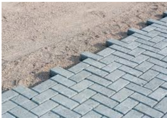
FIGURA 5 - IMAGEM DO BLOCO DE CONCRETO INTERTRAVADO

A responsabilidade da contratada é o fornecimento e execução do colchão de areia e fornecimento e execução do bloco de concreto intertravado.