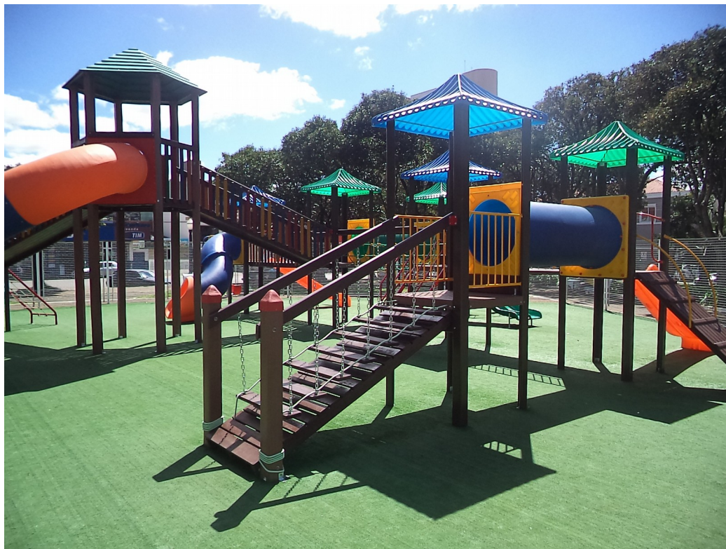
FIGURA 11 - IMAGEM PLAYGROUND INFANTIL COLORIDO

Site: www.paranagua.pr.gov.br e-mail: cpl@pmpgua.com.br