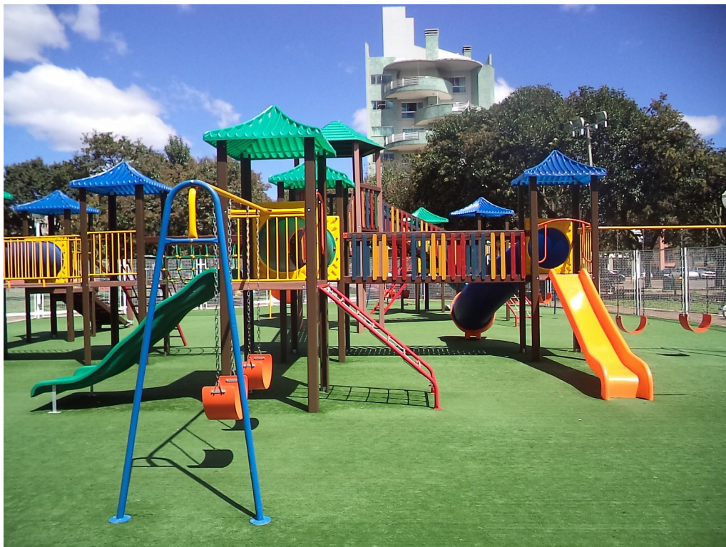
FIGURA 8 - IMAGEM PLAYGROUND INFANTIL COLORIDO

Site: www.paranagua.pr.gov.br e-mail: cpl@pmpgua.com.br