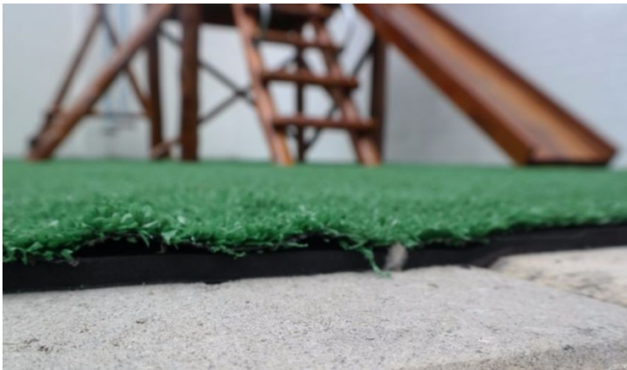
FIGURA 6 - IMAGEM DA BASE PARA INSTALAÇÃO DA GRAMA SINTÉTICA

Piso de concreto usinado para playground, instalado de 20mpa com 5 a 6 cm de espessura, com desnível de 3% próprio para playground, queimado/polido. Inclusa mão de obra e materiais como madeira, ferro, bomba para descarregamento.