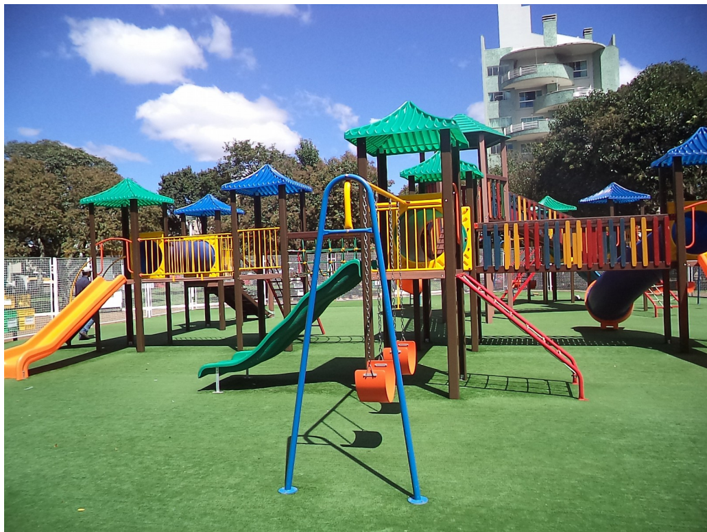
FIGURA 9 - IMAGEM PLAYGROUND INFANTIL COLORIDO

Site: www.paranagua.pr.gov.br e-mail: cpl@pmpgua.com.br