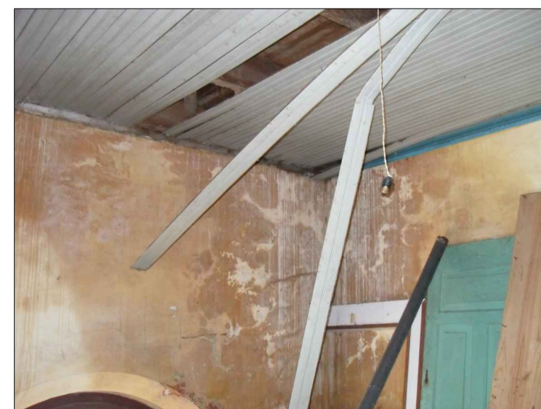
11) FORRO EM MADEIRA, PAREDE E PINTURA COM UMIDADE E APODRECIMENTO.

OBS: FOTOS DO ESTADO DE CONSERVAÇÃO DE 2010