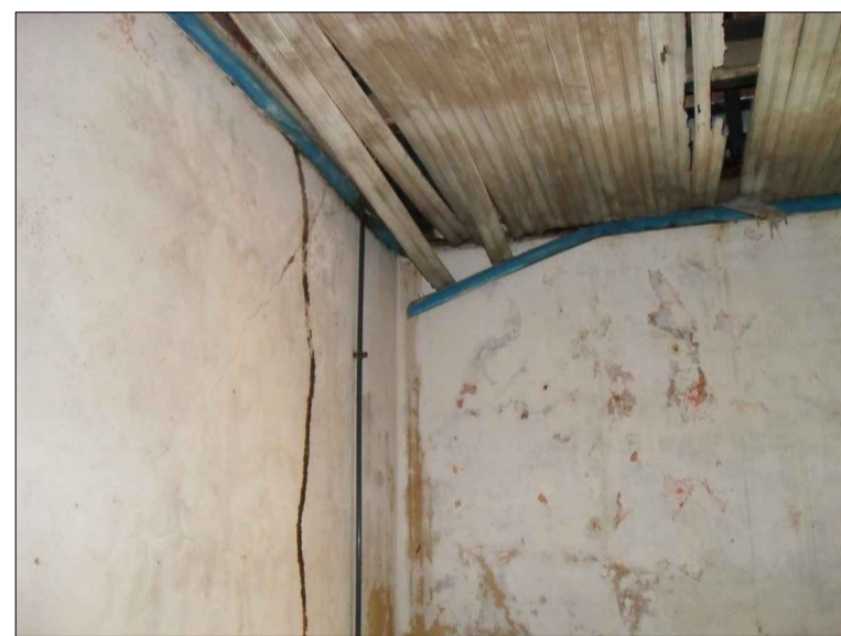
08) FORRO EM MADEIRA, PAREDE E PINTURA COM UMIDADE E APODRECIMENTO.