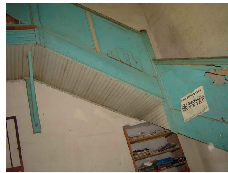
02) GUARDA-CORPO DA ESCADA DANIFICADO.