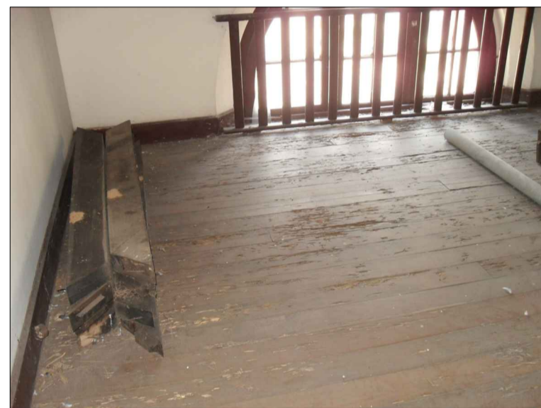
06) PISO EM MADEIRA DANIFICADO POR INSETOS.