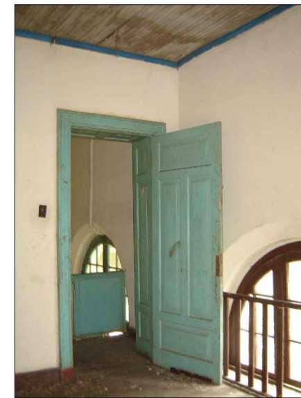
04) DETALHE DA PORTA.