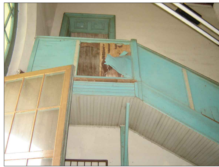
01) GUARDA-CORPO DA ESCADA DANIFICADO.