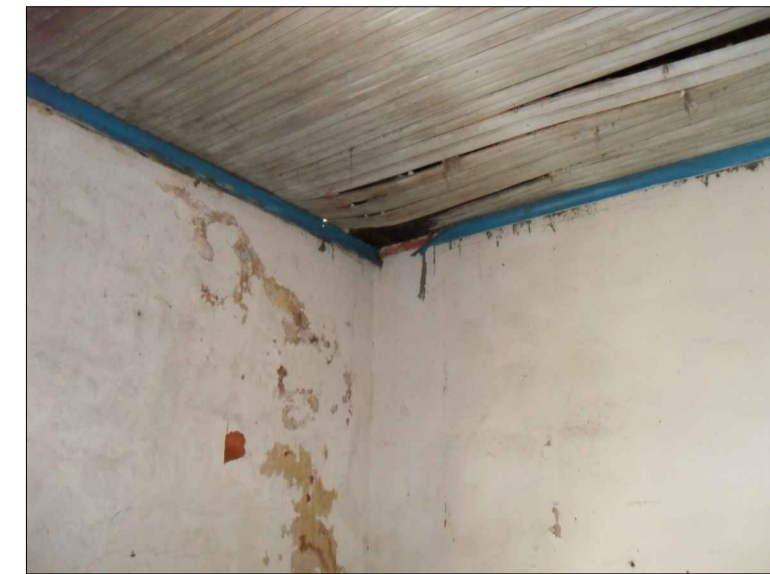
05) FORRO EM MADEIRA COM SINAIS DE UMIDADE E APODRECIMENTO.