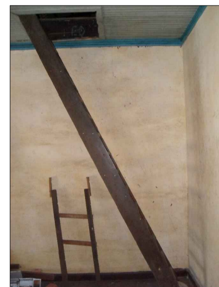
09) ESCADA E ALÇAPÃO.