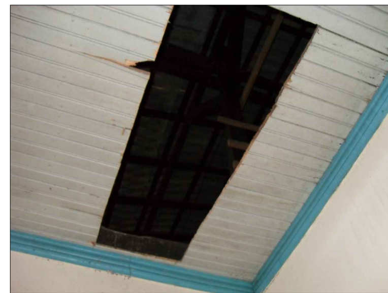
07) FORRO EM MADEIRA CORTADO.