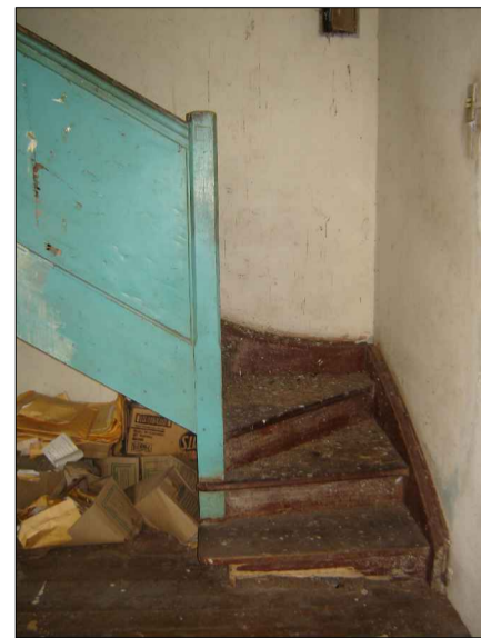
03) BASE DA ESCADA DANIFICADA.