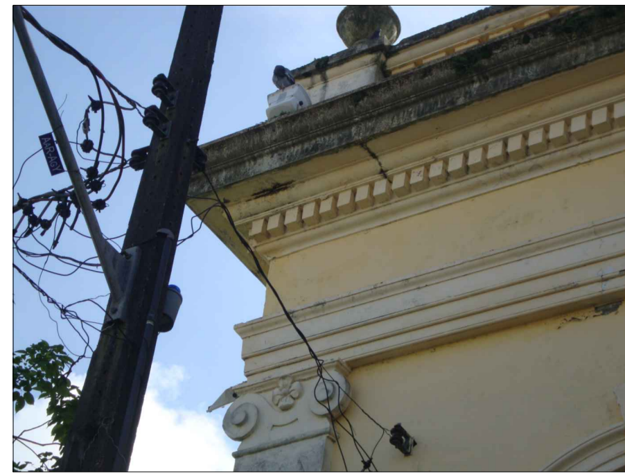
01) PINTURA DESCASCANDO E COM MANCHAS, ENTRADA DA REDE ELÉTRICA.