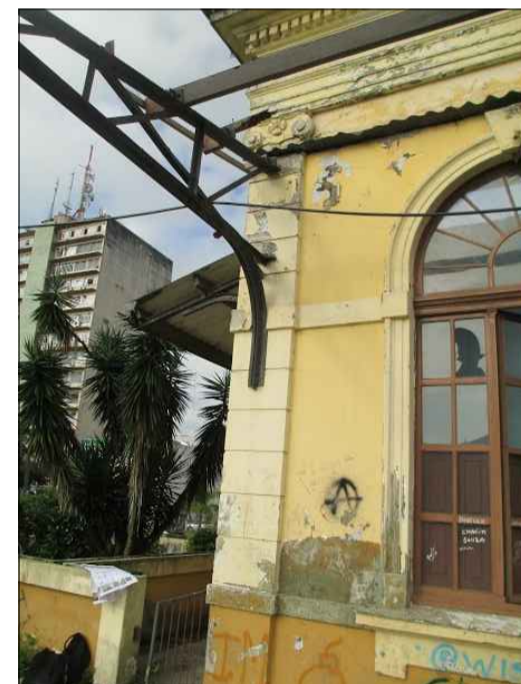
08) PAREDE DESCASCANDO, CORROSÃO DA ESTRUTURA DA COBERTURA, ESQUADRIA DANIFICADA.