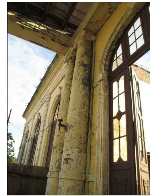
02) PINTURA DESCASCANDO E COM MANCHAS NA FACHADA E NOS ORNAMENTOS.