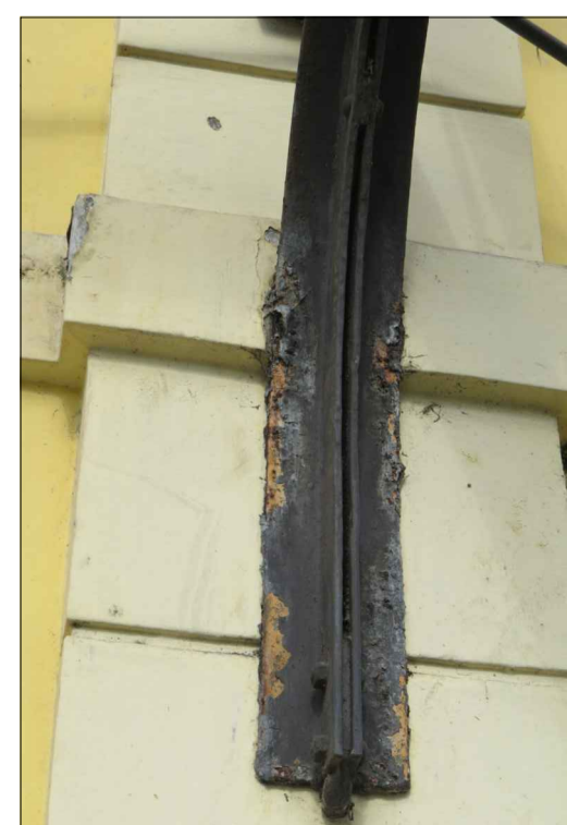
10) CORROSÃO DA ESTRUTURA DE APOIO DA COBERTURA.