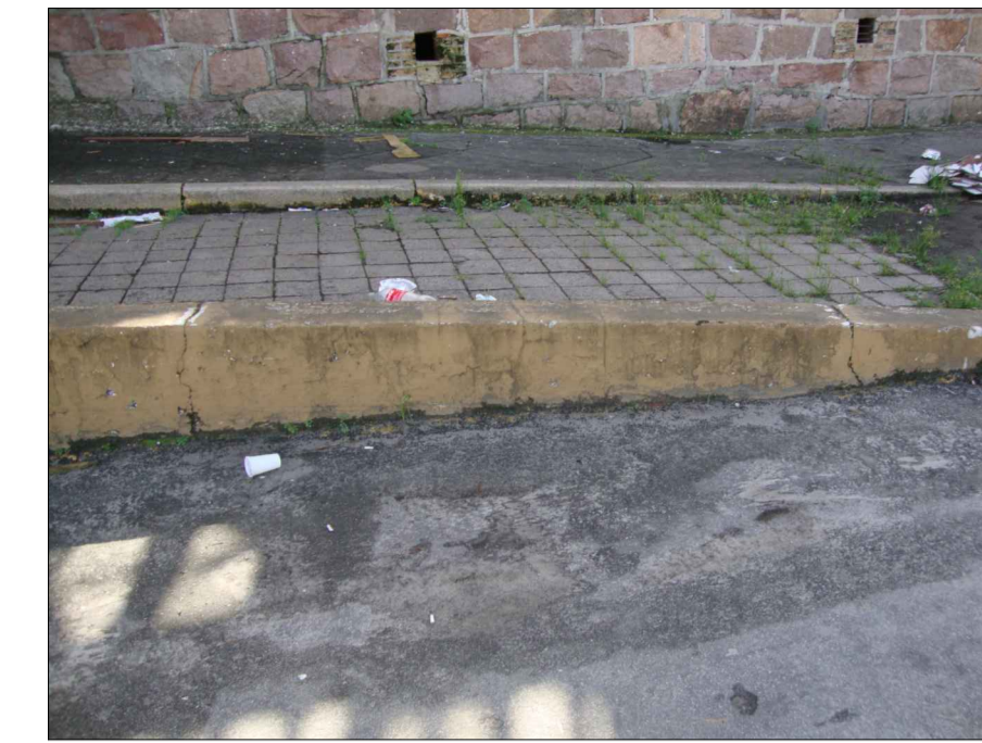
05) RACHADURAS E VEGETAÇÃO NA RAMPA DE ACESSO À ESTAÇÃO.