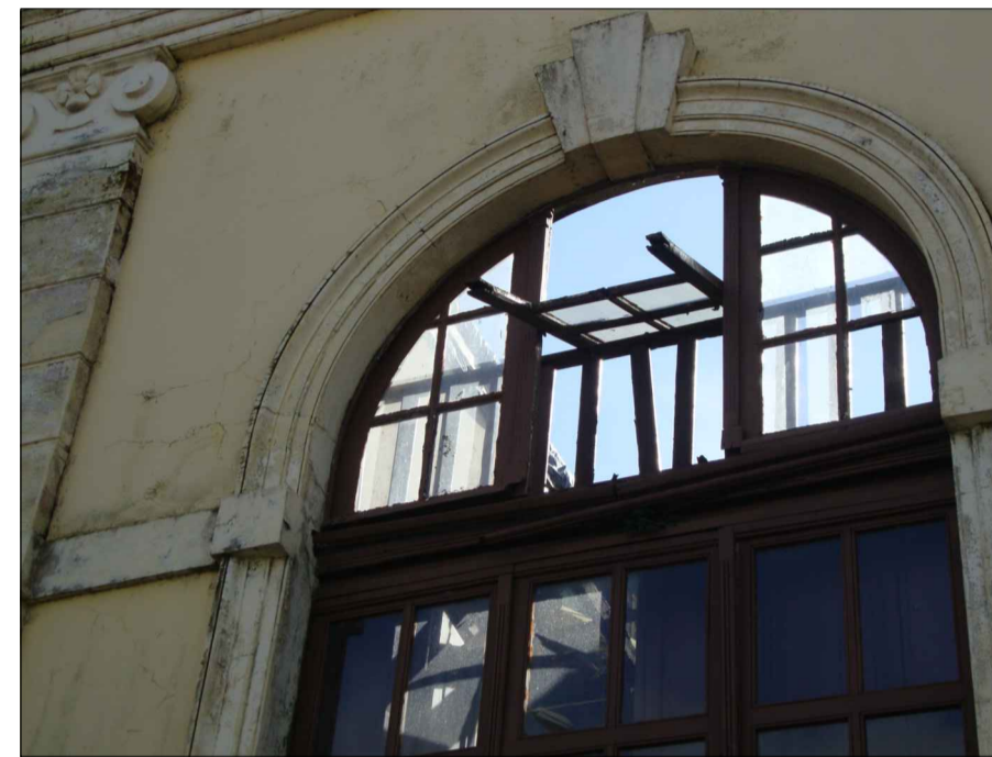
07) MAU ESTADO DE CONSERVAÇÃO DA ESQUADRIA E DOS ORNAMENTOS, FISSURAS E SUJEIRA NA PAREDE.