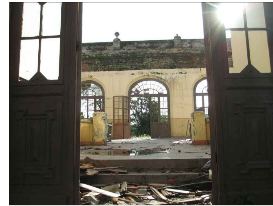
04) VISTA A PARTIR DA PORTA DA ENTRADA.