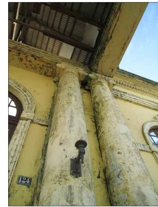
03) PINTURA DESCASCANDO E COM MANCHAS NA FACHADA E NOS ORNAMENTOS.