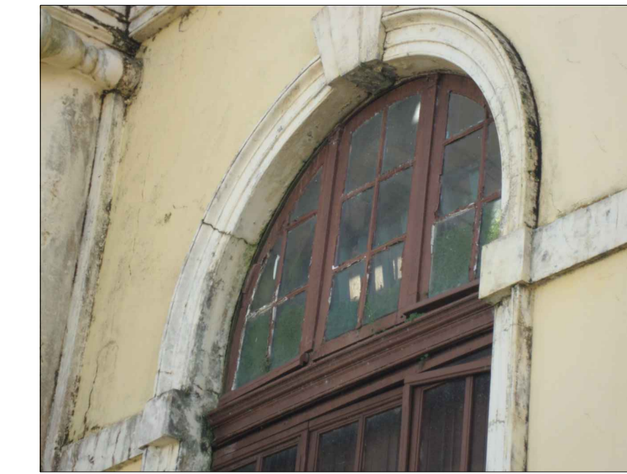
06) MAU ESTADO DE CONSERVAÇÃO DA ESQUADRIA E DOS ORNAMENTOS, FISSURAS E SUJEIRA NA PAREDE.