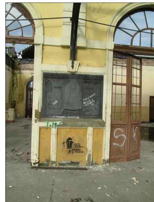
09) PLACA METÁLICA, CORROSÃO DA ESTRUTURA DA COBERTURA, ESQUADRIAS DANIFICADAS.