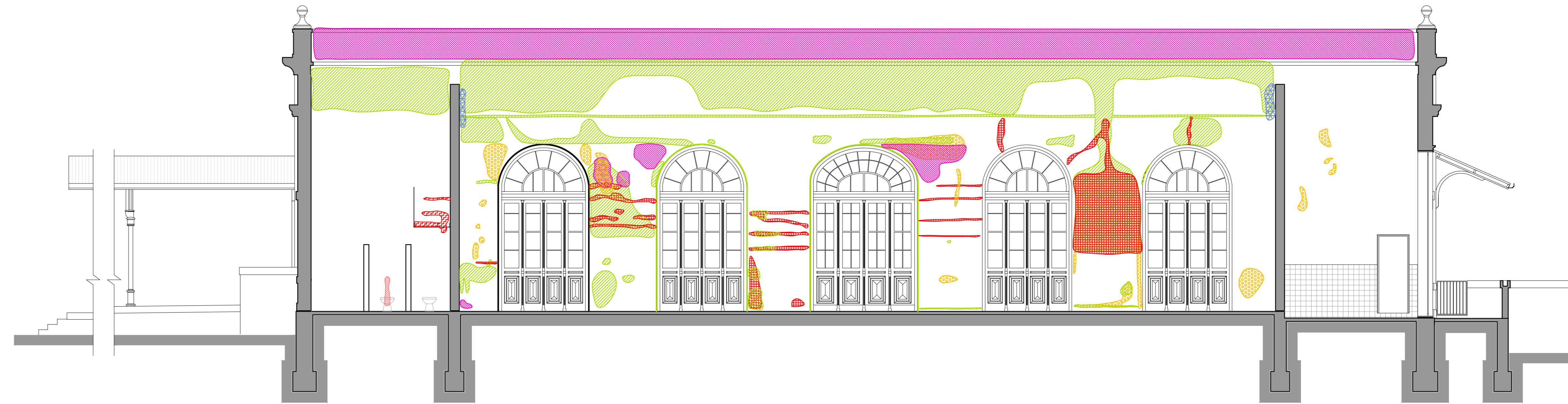
CORTE BB' ESCALA 1:75