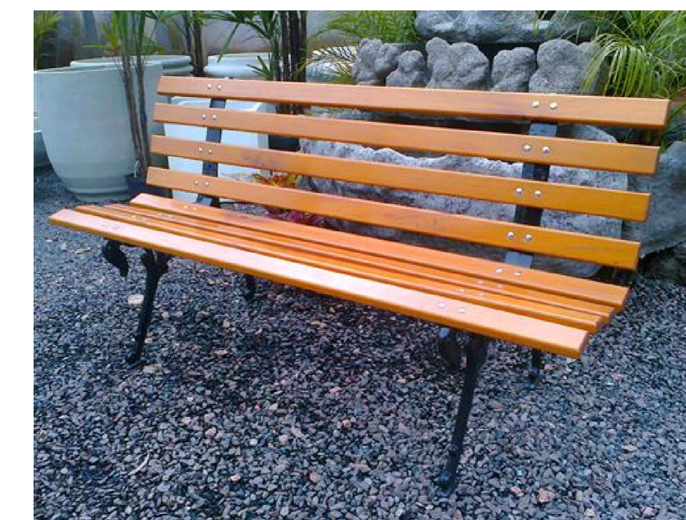
MODELO DO BANCO JARDIM