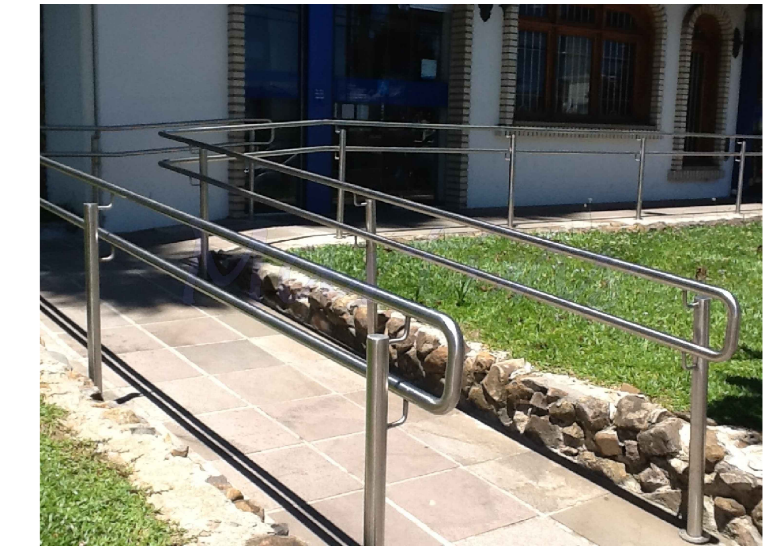
MODELO DO CORREMÃO