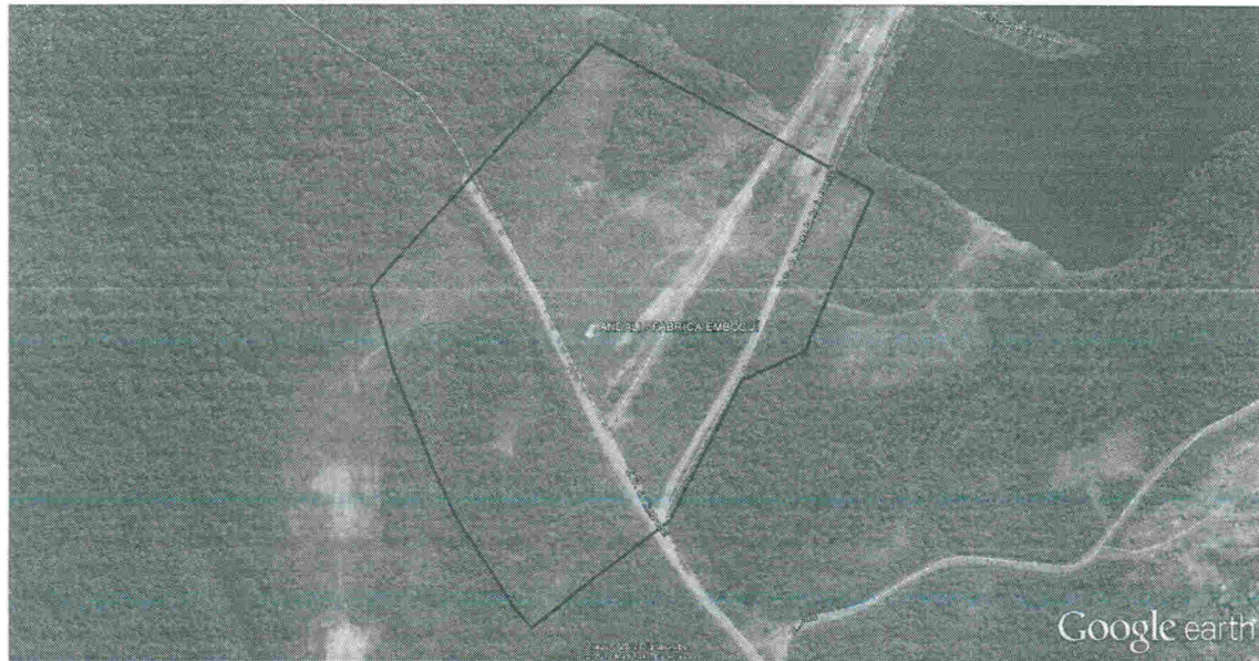
Figura 1: Foto aérea da localização da FÁBRICA IMBOCUÍ