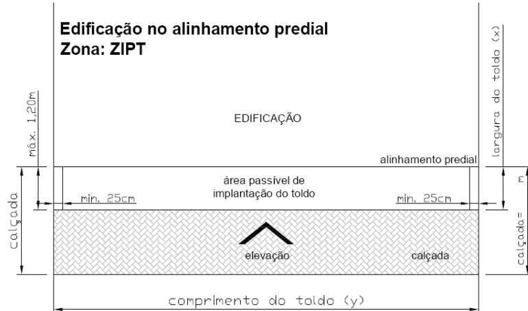
Planta sem escala

PREENCHER OS CAMPOS DE ACORDO COM AS MEDIDAS DO TOLDO. ATENTAR PARA AS MEDIDAS MÁXIMAS E MÍNIMAS.