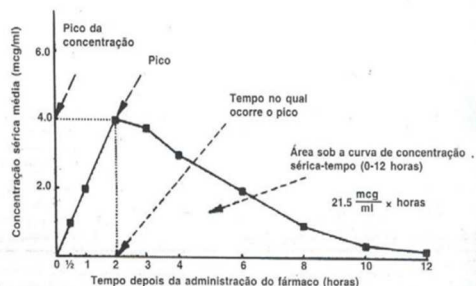
FIGURA 1: Curva de concentração sérica vs. tempo, mostrando a elevação máxima de concentração e a área sob a curva (ANSEL et al., 2000).